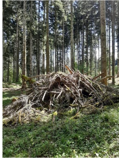
Kup vej, ki je na karti ni