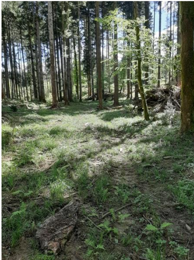
Vlaka na terenu, ki je na karti ni