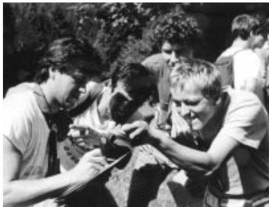
... in z mladimi navdušenci