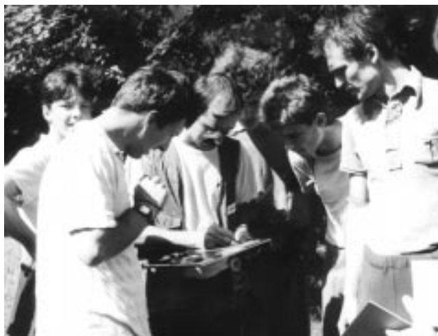
Tečaj risanja kart v Bohinju leta 1988